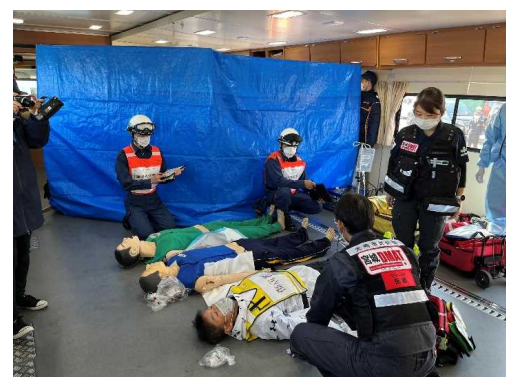
拠点機能形成車内DMAT活動状況