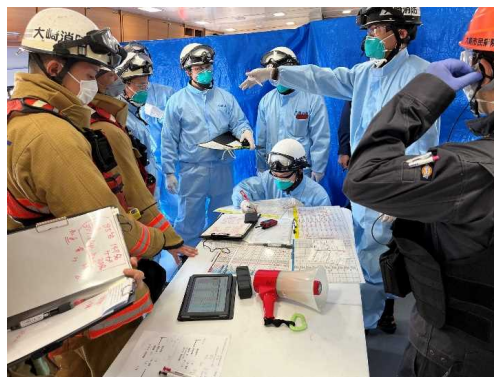
拠点機能形成車内現場本部活動状況