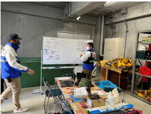
副訓練棟内仮想病院